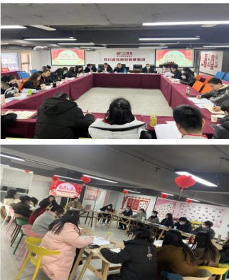
工会组织分组讨论会议