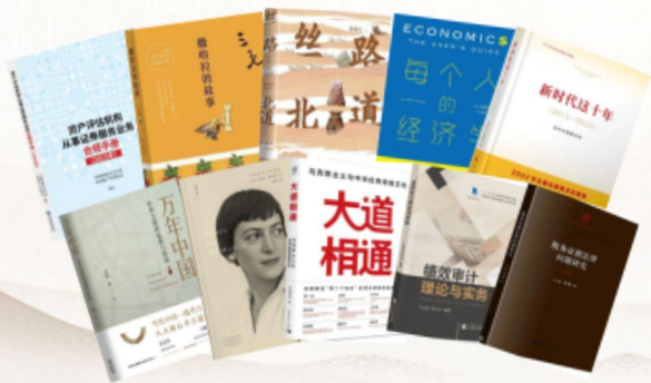
(图：四川普林财税管理集团微信公众号“书香普林”原创专栏推荐书目示例)

此外，普林组织开展“购买一批好书”“推荐一本好书”“同读一本好书”活动，根据行业党委、协会推荐的书单，鼓励员工为书屋捐赠书籍，鼓励员工推荐书籍，通过员工“点菜”，普林“上菜”的模式，不断丰富普林书屋、普林书角的书籍数量和范围，现已经购置、推荐的线上线下书籍领域广泛，包括党政、文史、管理、财税政策法规工具书等类型书籍，供普林人随时阅读、学习。