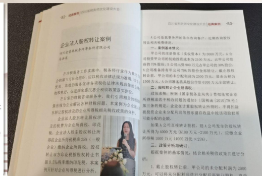
(图：马洪英副总结写的《企业法人股权转让案例》)