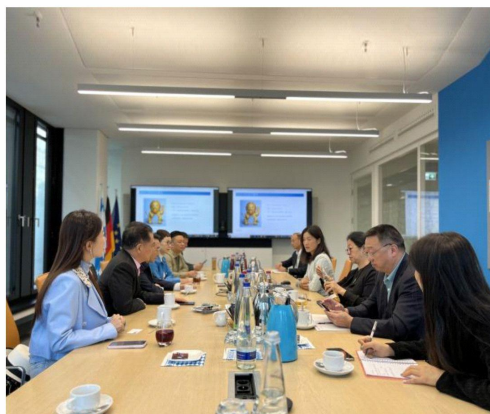
(省工商联代表团拜访俄罗斯经济、统一发展和能源部、巴伐利亚投促局)