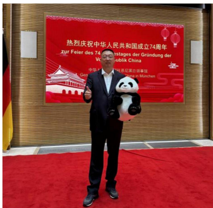
(省工商联代表团参加中国驻慕尼黑总领事馆举办的国庆74周年招待会)