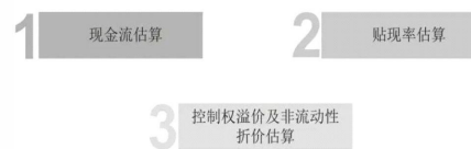
图1 与现金流贴现法有关的3项工作

互联网公司创新模式频出、发展周期短、更替速度快、变化幅度较大，这使其估值难度较大，而且评估机构也难以参与到其估值工作之中。因此，与一般公司的估值方法不同，互联网公司的估值方法还需要不断摸索与创新。