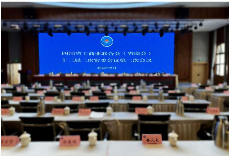
四川省工商联（省商会）十二届二次常委会议现场

会议审议通过了有关人事事项及《四川省工商联（省商会）企业家执委履职情况评价办法（试行）》，并发布了《四川省民营企业绿色发展报告（2022）》。